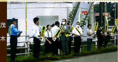
中学生を交えた交通安全啓発活動