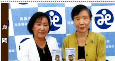
高齢者交通事故防止の反射ストラップを寄贈