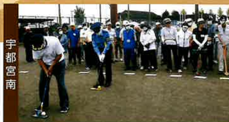
交通事故ゼロを祈願して「一打入魂」