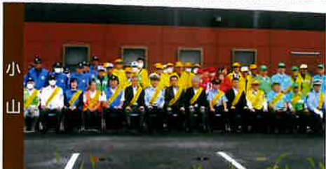
小山市・結城市合同交通安全啓発に協力