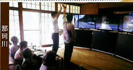
敬老会にシミュレーターによる安全教室を開催