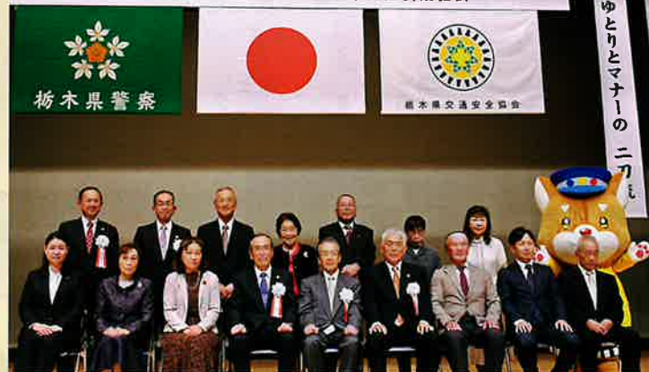
受賞者代表のみなさま