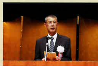
栃木県警察本部長