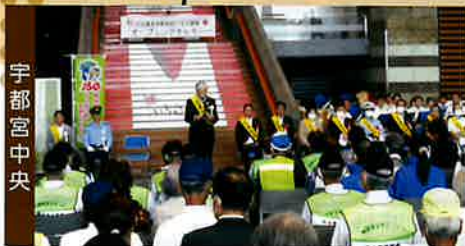
秋の交通安全県民総ぐるみ運動