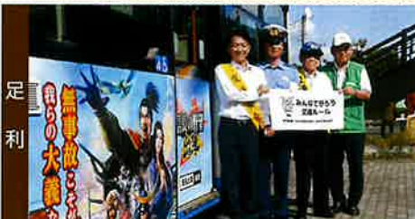
秋の交通安全、ラッピングバスでPR