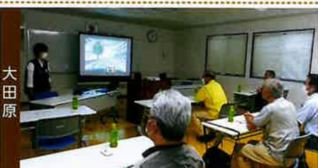
KYT交通講習会(各安協支部長等受講)