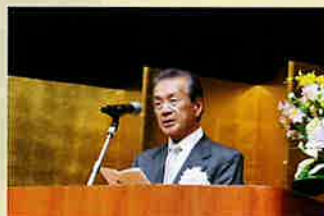
栃木県交通安全協会長