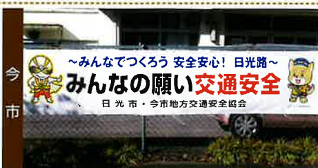
日光仮面とコラボ！横断幕