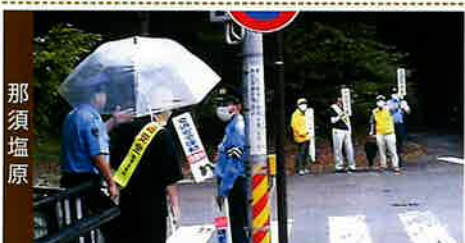
「秋の交通安全運動街頭啓発活動」

交通安全協会では、交通事故のない安全で快適な交通社会実現のため、様々な活動を行っております。活動の支えは、会員の皆様から頂いた会費です。 交通安全協会の活動をご理解の上、運転免許の更新時等の際には、ぜひ、ご入会をお願い致します。