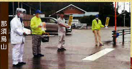
県下一斉自転車広報の実施