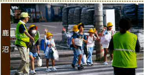
前みて、右みて、左みて！