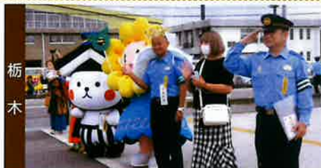
栃木地区3大キャラと署長に見送られ広報出発