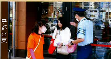
「チョコパン」配布でチョコまか確認、事故防止