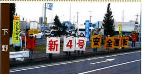
プレートなどで事故防止を呼び掛け