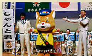
表彰式第二部警察音楽隊の公演で 栃木県交通安全協会公式キャラクター 「ちゃんど君」が紹介されました。