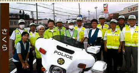
広報周知活動も終わって、ハイチーズ！