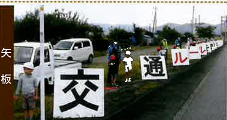
ふにゅう保育園児による交通安全広報