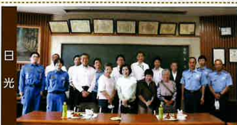
女性部会が署員に慰労会を開催した