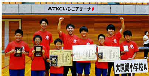
▲ 準優勝チーム 那須塩原市立大原間小学校A