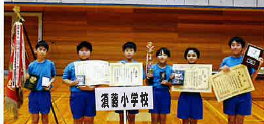
▲ 優勝チーム 茂木町立須藤小学校