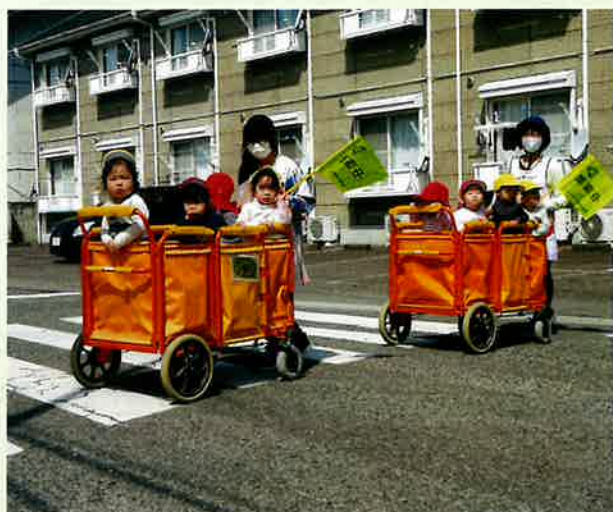
第11回 写真コンクール 優秀作品