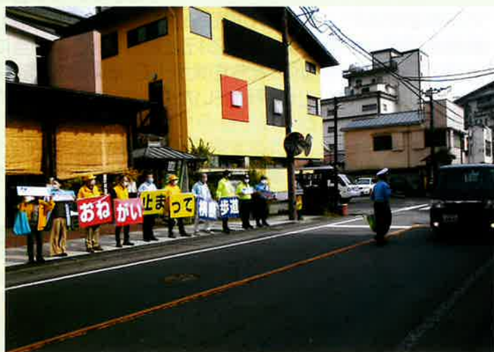
第11回 写真コンクール 優良作品