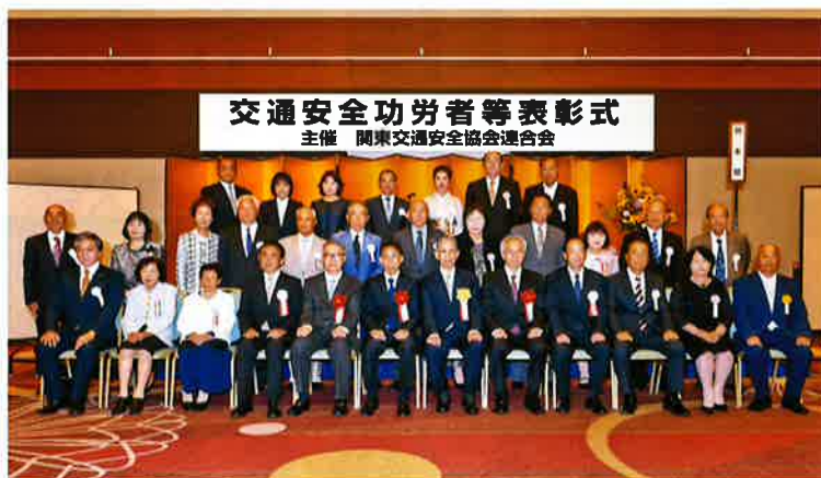
優良交通安全協会/さくら地区交通安全協会/矢板地区交通安全協会